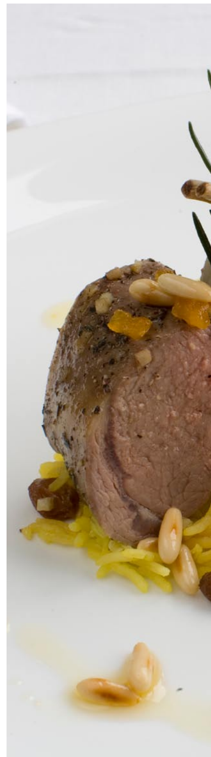
D. Die Sultaninen und Gewürze wie Safran, Zimt und Lorbeer verleihen dem Pilaw den süsslichen Geschmack.